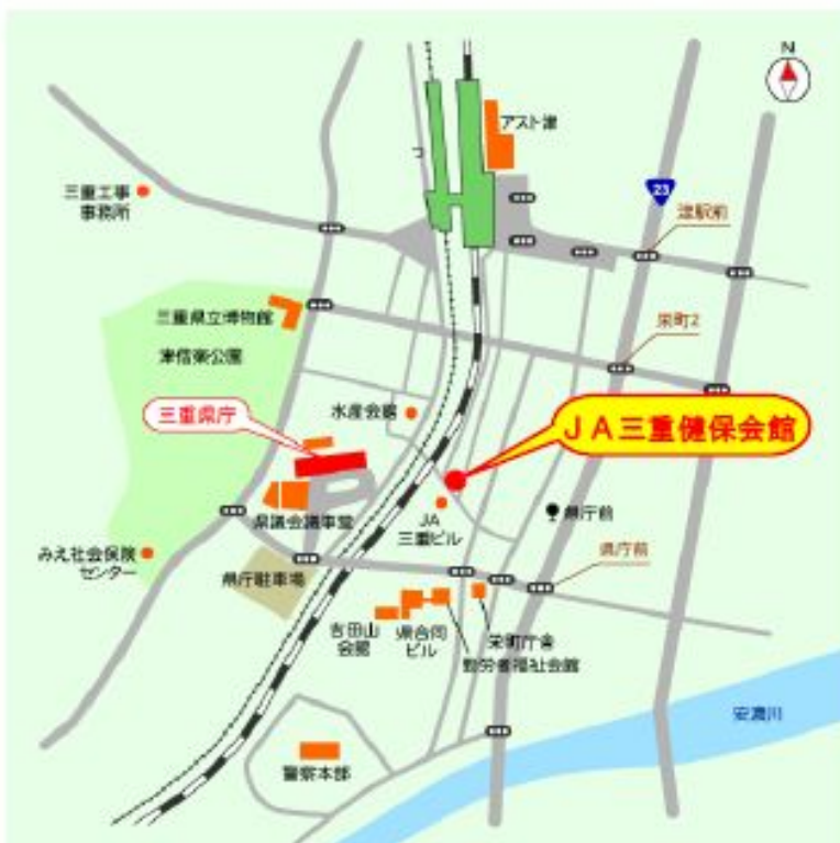
J A 三重健保会館 地図