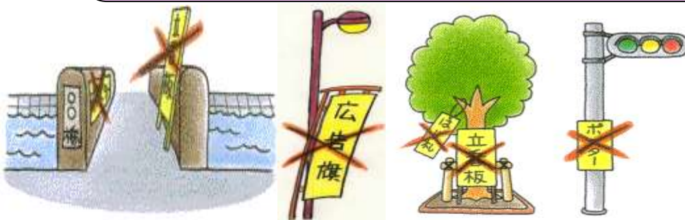
(禁止物件のイメージ図)