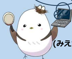
（みえ女性活躍・両立推進キャラクター） 「こきんちゃん」

法の解説資料、育児・介護休業等に関する規則の規定例（掲載時期未定）、過去の説明会のアーカイブ動画などはこちらから