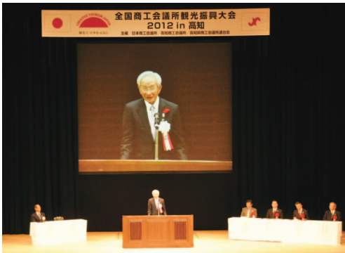
全国の商工会議所から約840人が参加した