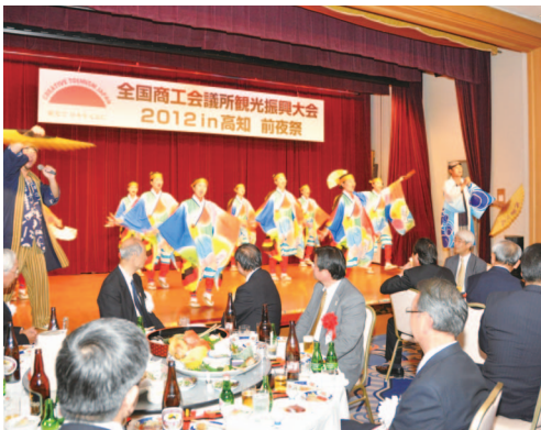
前夜祭のアトラクションで盛り上がる参加者

日本商工会議所は10月24～27日、高知商工会議所、高知県商工会議所連合会と共催で、「全国商工会議所観光振興大会2012in高知」を高知市や高知県内で開催。全国から商工会議所の会員や観光関係者ら約840人が参加した。